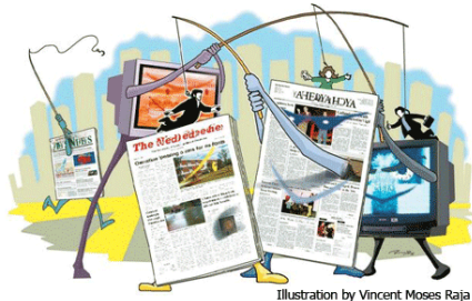
Illustration by Vincent Moses Raja

Kiedys mówiło się, że złe wiadomości sprzedają ( bad news sell ). Dziś newsy nie zawsze są już potrzebne. Po co informować, lepiej kogoś atakować. Najlepiej TAMTYCH. Jeżeli dołożą któremuś z TAMTYCH, nakład lepiej się sprzeda, będzie większa klikalność. Ale IM zrobili! Należało się. Obrzydliwe, ale fajne. Brawo, świetna okładka!